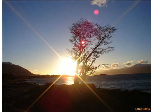
Winnende foto schoolproject 'Fotografeer het mooiste plekje op je eiland' (Isla Navarino, Chili)

genoemde en eventuele andere groepen belanghebbenden.